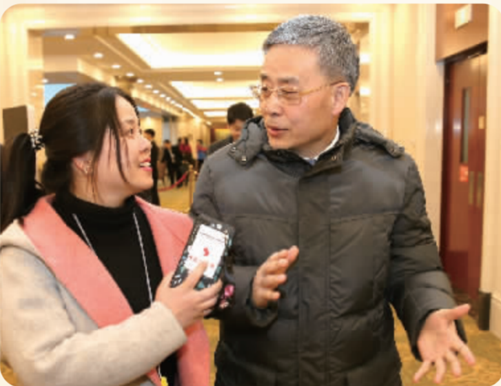
中国人民银行党委书记、中国银保监会主席郭树清接受中国证券报记者采访