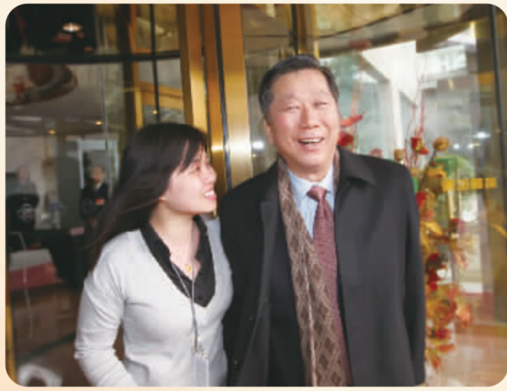
中国证监会原主席尚福林接受中国证券报记者采访