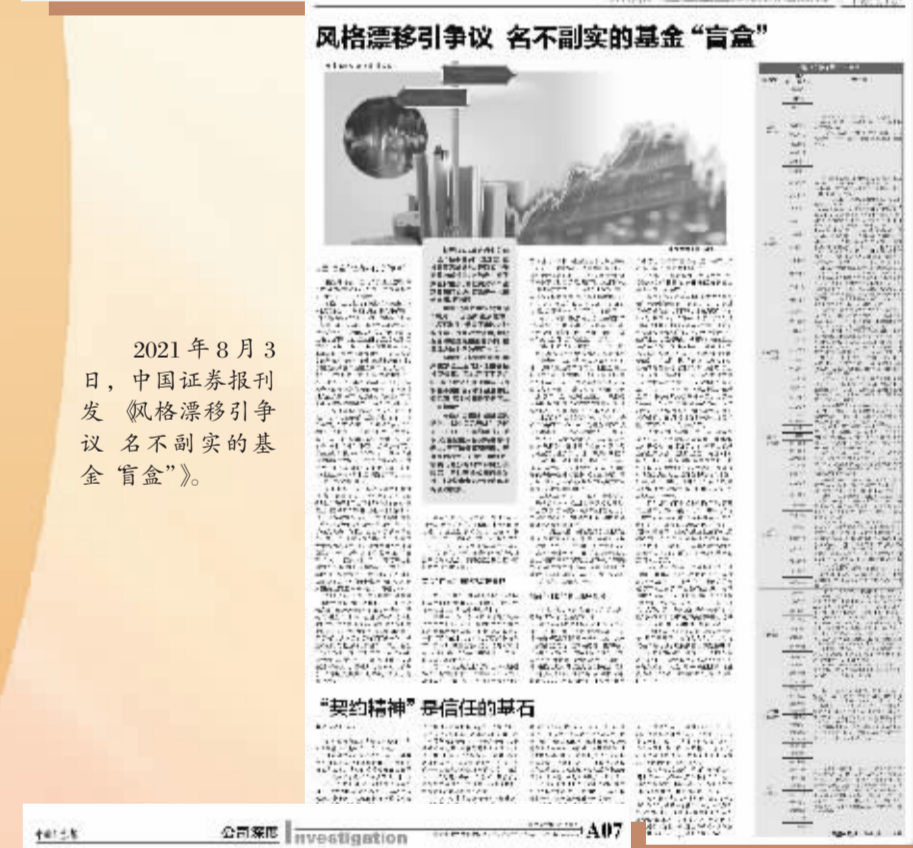
2021年8月3日,中国证券报刊发《风格漂移引争议 各不副实的基金“盲盒”》。