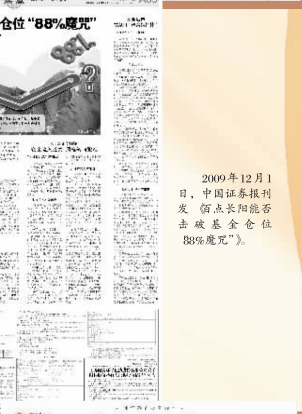
2009年12月1日,中国证券报刊发《百点长阳能否击破基金仓位“88%魔咒”》。