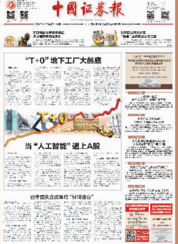
2016年10月13日,中国证券报在头版头条刊发《T+0 地下工厂大起底》。