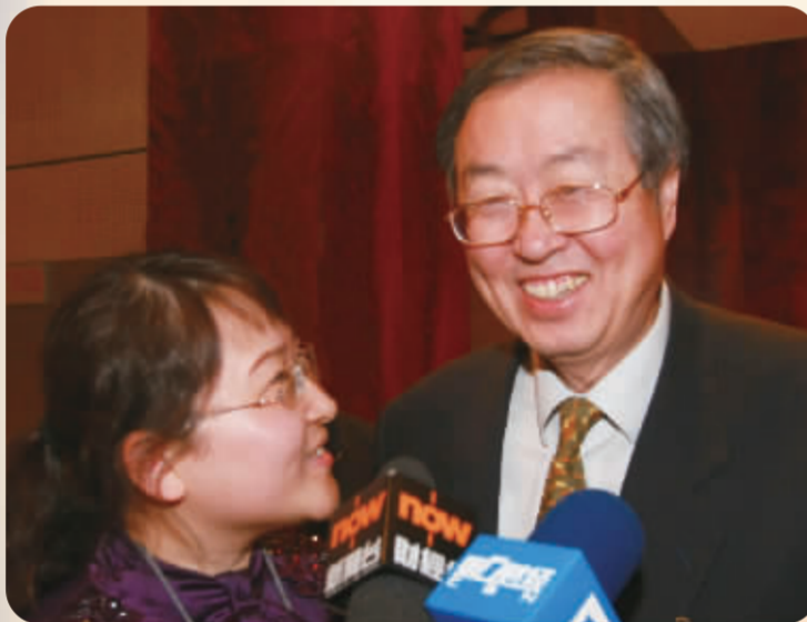
中国人民银行行长周小川接受中国证券报记者采访