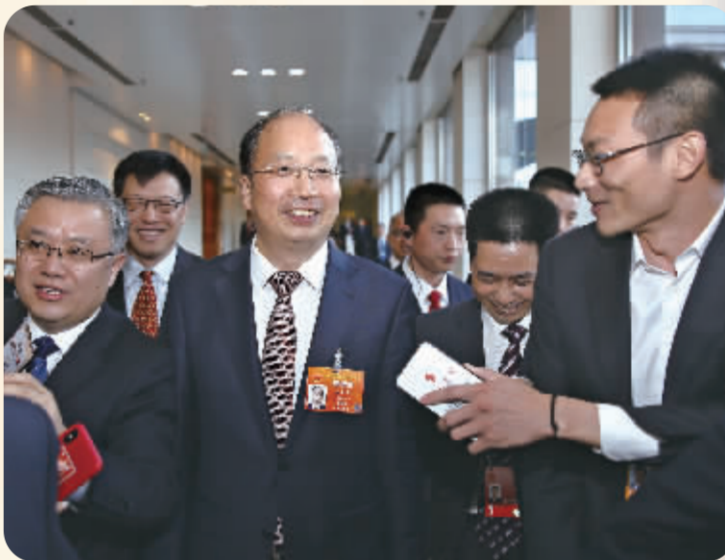
中国证监会主席易会满接受中国证券报记者采访