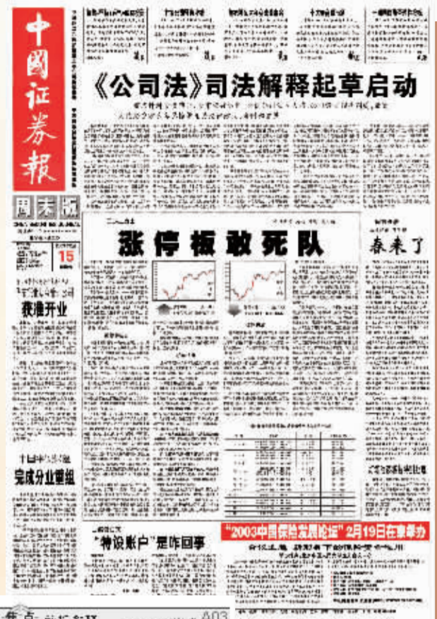
2003年2月15日,中国证券报在头版刊发《涨停板敢死队》,首次披露银河证券宁波解放南路营业部“涨停板敢死队”的操作手法,被媒体广泛转载。